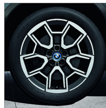
V 輻式 867