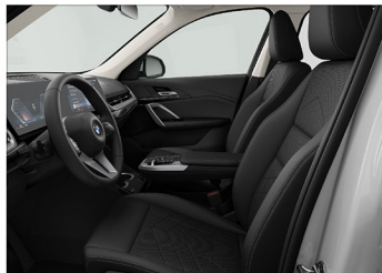
Veganzo 透氣皮質 / 標準座椅 X1 sDrive18i xLine