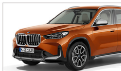
X1 sDrive20i xLine