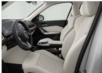
Veganzo 透氣皮質 / 跑車座椅 X1 sDrive20i xLine