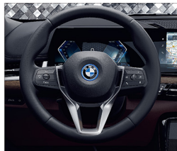
跑車多功能真皮方向盤