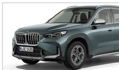
X1 sDrive18i xLine