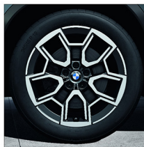
V 輻式 867