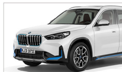
iX1 xDrive30i xLine