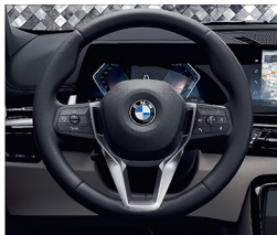
跑車多功能真皮方向盤