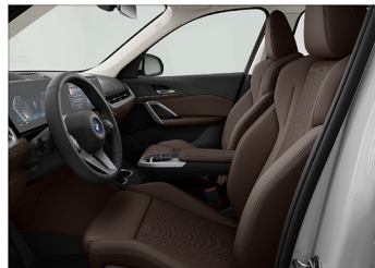
Veganzo 透氣皮質 / 跑車座椅 iX1 xDrive30 xLine